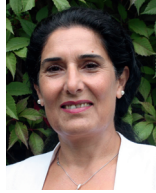
Behiye Ateş Deutsch, Türkisch und Kurdisch Kindertageseinrichtungen