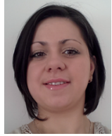
Silvana Lascu Deutsch und Rumänisch Kindertageseinrichtungen und Schulen