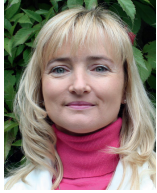
Violetta Glenz Deutsch und Polnisch Kindertageseinrichtungen und Schulen