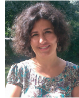
Sevim Ezen Deutsch und Türkisch Kindertageseinrichtungen und Schulen