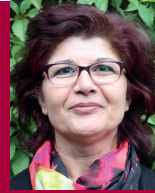
Nischtiman Salih Deutsch, Arabisch und Kurdisch Kindertageseinrichtungen und Schulen