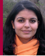
Schewa van Uden Deutsch, Arabisch und Kurdisch Kindertageseinrichtungen und Schulen