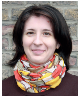
Emilia Pana Deutsch und Rumänisch Kindertageseinrichtungen und Schulen