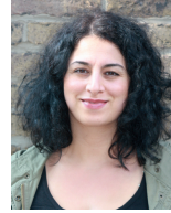
Tülay Sahin Deutsch und Türkisch Schulen