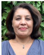
Nesrin Tunç Deutsch und Türkisch Kindertageseinrichtungen