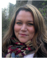
Özlem Asar Deutsch und Türkisch Kindertageseinrichtungen und Schulen