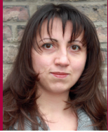
Naziyeh Majar Deutsch und Türkisch Schulen