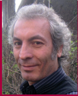
Mustafa Cebe Deutsch und Türkisch Kindertageseinrichtungen