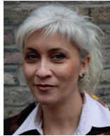
Nergis Kaplan Deutsch und Türkisch Kindertageseinrichtungen