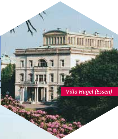
Villa Hügel (Essen)