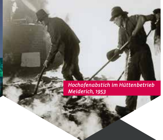
Hochofenabstich im Hüttenbetrieb Meiderich, 1953