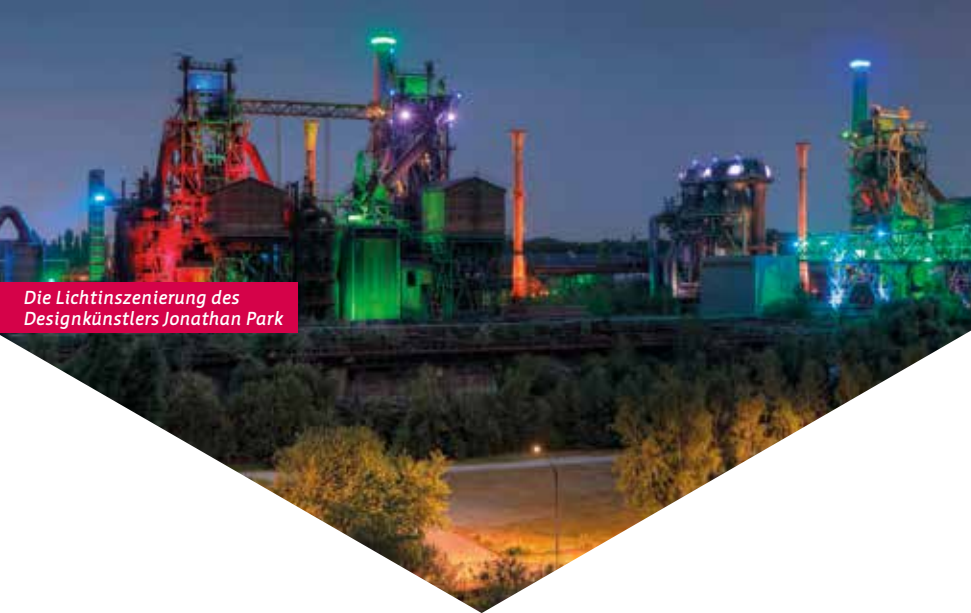
Die Lichtinszenierung des Designkünstlers Jonathan Park