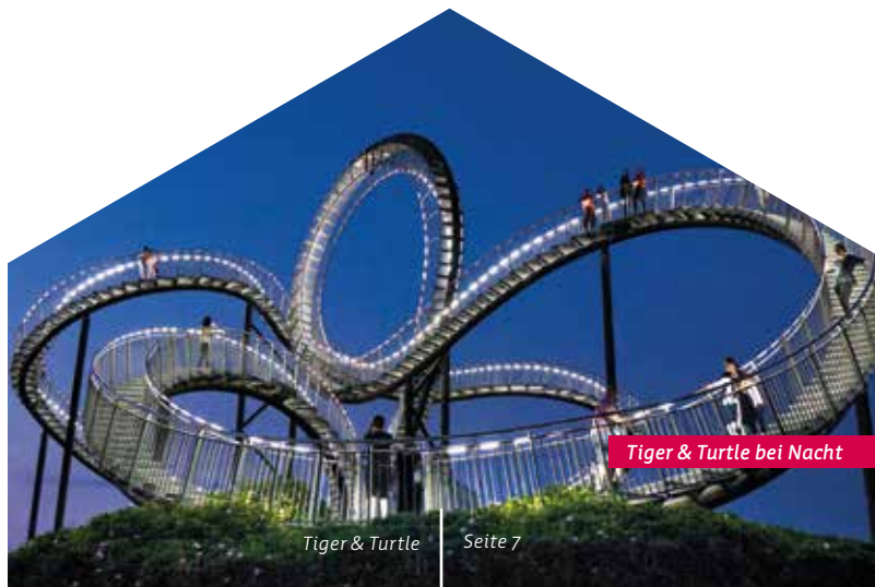
Tiger & Turtle bei Nacht

Ehinger Straße 117 | 47249 Duisburg www.tigerandturtle.duisburg.de