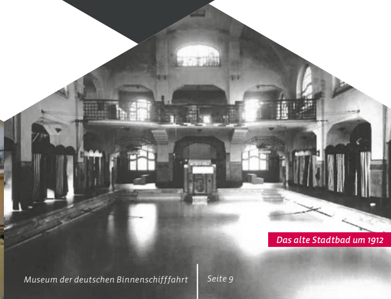
Das alte Stadtbad um 1912