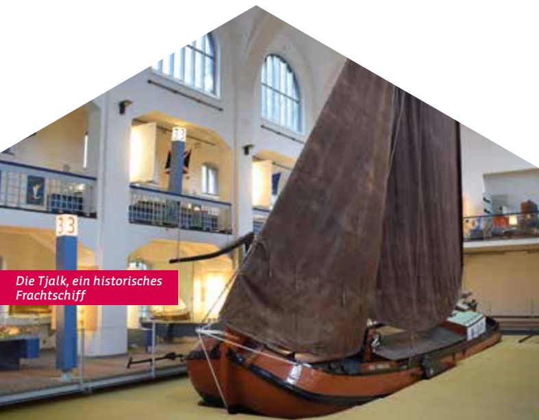
Die Tjalk, ein historisches Frachtschiff

Das heutige Museum befindet sich in einem ehemaligen Jugendstilhallenbad. Es eröffnete 1910 und hatte zwei Schwimmhallen. Eine für Männer und eine für Frauen. Die Hausordnung war streng. So hieß es zum Beispiel: „Hühneraugenoperationen dürfen in der Anstalt nicht vorgenommen werden.“