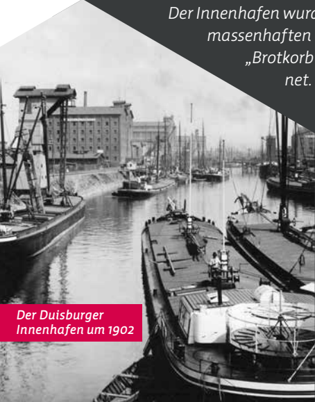
Der Duisburger Innenhafen um 1902

Der Innenhafen wurde früher wegen des massenhaften Getreideumschlags als „Brotkorb des Ruhrgebiets“ bezeichnet. Mit dem Niedergang der Getreidemühlen Ende der 1960er Jahre war dann auch der Niedergang des damaligen Duisburger Innenhafens unvermeidlich. Ab Mitte der 1990er Jahre begannen dann die Umwandlungsarbeiten nach Plänen des britischen Stararchitekten Sir Norman Foster.