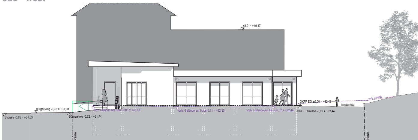
west - nord